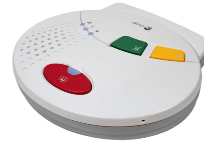
1x Basisgerät inkl. Netzteil