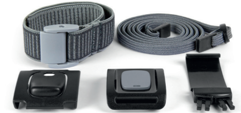
1x Arm & Halskette

*Gerätetyp, Optik und Färbung können abweichen.